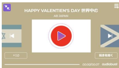
⑥ベーシック：ベージュ