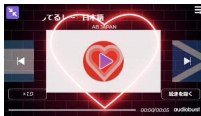
②バレンタインデザインⅡ