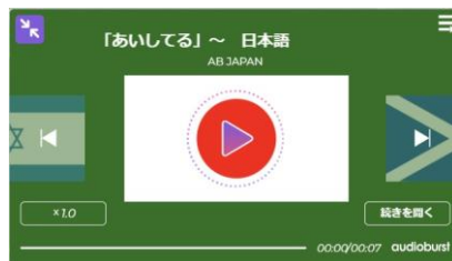
⑦ベーシック：グリーン