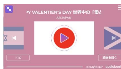
⑧ベーシック：ラシット

この度、新しく導入されるエンベデッドプレイヤーでは、背景の変更や、再生ボタンへのアニメーションの追加が可能になりました。