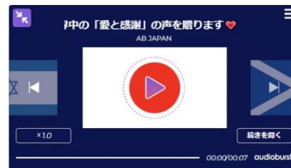
⑤ベーシック：ネイビー