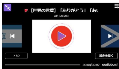
③ベーシック：ブラック