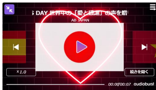
【愛と感謝を伝える日本語版「プレイヤー」画像例】

この度、新しく導入されるエンベデットプレイヤーでは、背景の変更や、再生ボタンへのアニメーションの追加が可能になりました。そこで、バレンタインデーにちなんで、愛の感情を表すハートを採用しており、ハートの背景はイルミネーションのようなネオンピンク色に点灯し、センター部分のハートはアニメーションが動くデザインを制作しました。（※詳細は次頁へ）